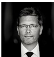
Frank Jensen Københavns overborgmester